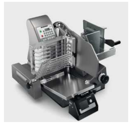
VS 12 C D W